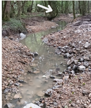
La Luire après travaux - diversifié et sinueux