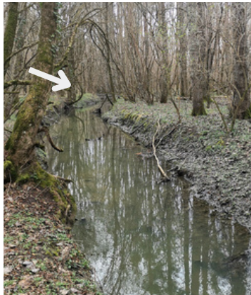
La Luire avant travaux - rectiligne et uniforme