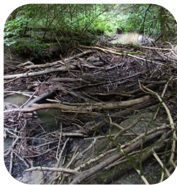
Embâcle retiré sur la Loire