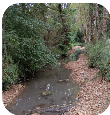
Recharge granulométrique sur la Loire - avant travaux à gauche et après travaux à droite