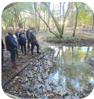
Présentation aux élus du SYAGC des travaux de restauration d'une source de la Loire