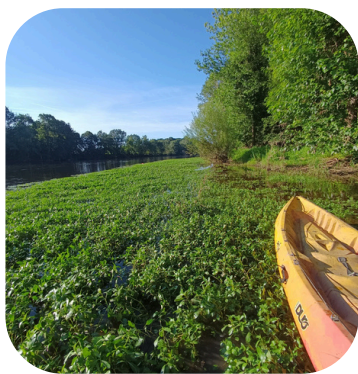
Herbier de Jussie arraché à la main sur la Creuse