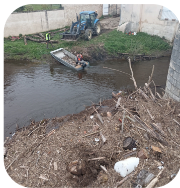
Embâcle retiré à Saint Savin